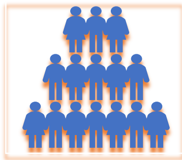
Un grupo humano: actividades divertidas

A través de ensayos dinámicos, se cohesionan las distintas voces que conforman el coro (sopranos, mezzos, altos, tenores y bajos) sin que eso suponga un encasillamiento formal en sólo una de ellas. Porque el objetivo que se plantea a todo cantante es adquirir habilidades y técnicas para desarrollar un amplio abanico de registros vocales.